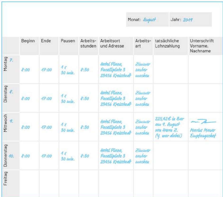
Abbildung: Beispiel eines Arbeitszeitkalenders